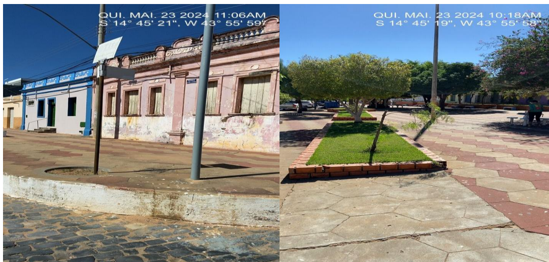
Imagem 9 - Poste indicativo e Poste de Concreto