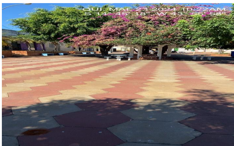
Imagem 1 – Piso da Praça a lavar

Será feita limpeza do piso da praça com uso de jato de água, para posteriormente aplicação da tinta, conforme planilha orçamentária.