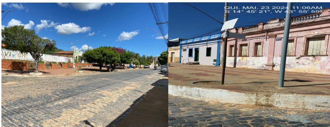
Imagem 3- Meio fio a pintar

Será executado serviço de pintura em torno de toda área aparente de todos MEIOS FIOS dos canteiros centrais, do tipo: tinta acrílica para os pisos em passeio/superfície cimentadas, duas demãos, cor: AMARELA, conforme planilha orçamentária.