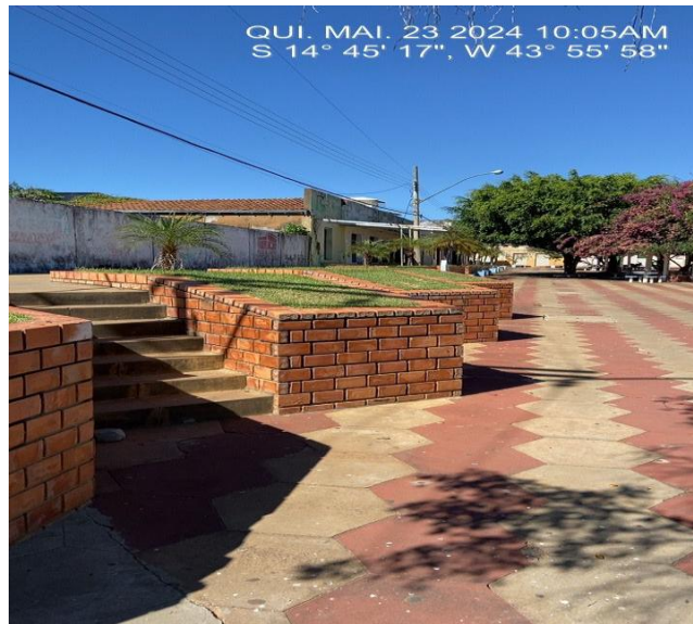
Imagem 2 Parede de Blocos Cerâmicos Aparente

Deverão ser seguidos rigorosamente os requisitos mínimos fixados pelas normas técnicas brasileiras para todos serviços descrito.