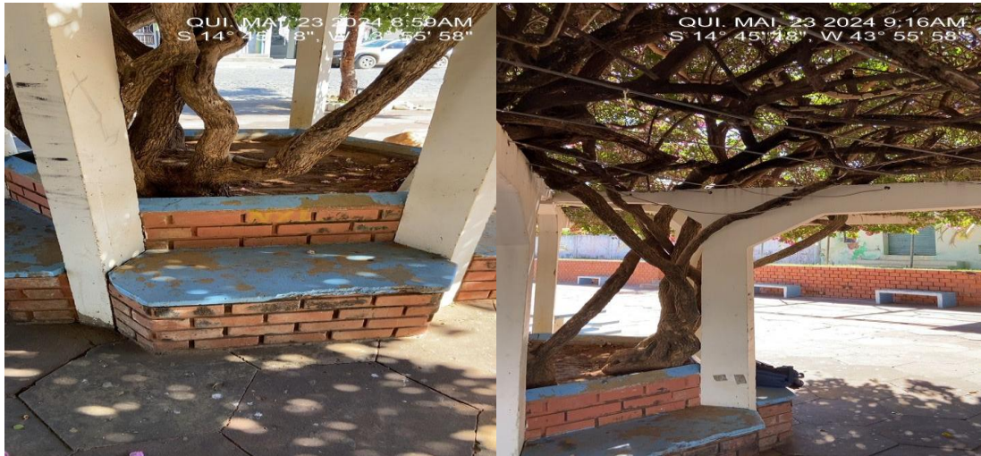
Imagem 7 – Postes e detalhes das Jardineiras

Será executado o serviço de Lixamento e pintura do tipo: acrílica para piso, nos postes e detalhes das jardineiras, COR: Concreto, conforme planilha orçamentária.