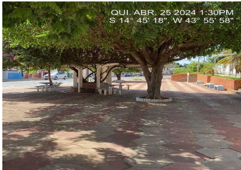
Imagem 4 – Piso da praça

Será feita a pintura do piso da praça, do tipo: tinta acrílica para os pisos em passeio/superfície cimentadas, duas demãos, cor: concreto e vermelho (cores existente do piso), conforme planilha orçamentária.