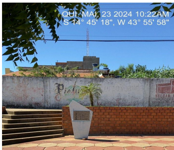
Imagem 10 – Placa de Obra

Serviço de lixamento e Pintura do tipo tinta acrílica para os pisos em passeio/superfície cimentadas, duas demãos, cor: concreto (conforme planilha orçamentária).