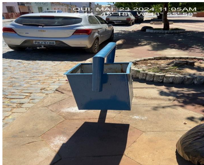
Imagem 4 – Lixeira a Pintar

Pintura com esmalte sintético acetinado em superfície metálica, exceto perfil, aplicação manual, duas demãos; na cor: azul delrey - lixeira. O suporte das lixeiras deverá ser executado com esmalte sintético acetinado para superfície metálica, na cor: AMARELA, com duas demãos.