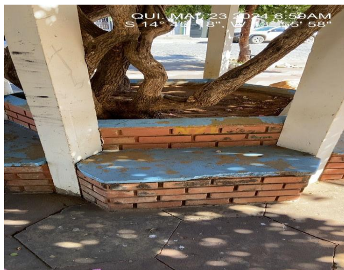
Imagem 6 – Parede de tijolo aparente

Será executado o serviço de lixamento e pintura do tipo: acrílica para piso, nas paredes das jardineiras, COR: Cerâmica, afim de obter a cor natural do tijolo aparente existente, conforme planilha orçamentária.