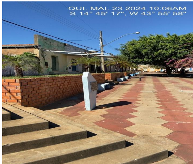
Imagem 5 – Banco a ser pintado na cor concreto

Será executado serviço de Lixamento e pintura nos bancos da praça, do tipo: tinta acrílica para pisos em passeio/superfície cimentadas, duas demãos, cor: cor concreto, conforme planilha orçamentária.