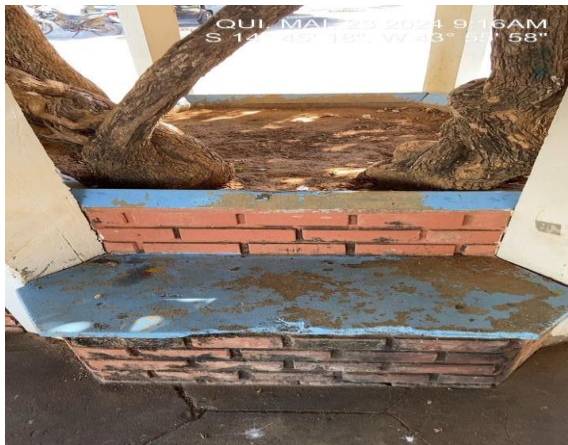
Imagem 11 – assentos das Jardineiras a receber o granito

Fornecimento e instalação de granito do tipo cinza andorinha, a ser aplicado nos assentos das jardineiras existentes, com uso de argamassa industrializada, inclusive rejuntamento. Deixar 2 cm na bordas externas para melhor acabamento, toda quantidade prevista em planilha orçamentária.