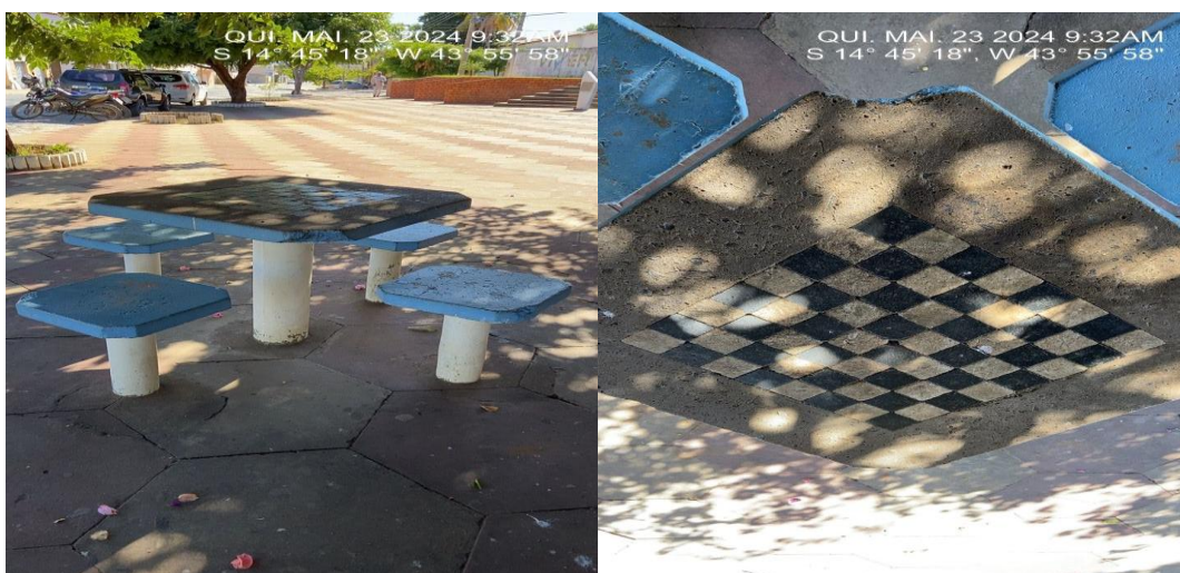
Imagem 8 – Mesas e assentos a ser pintados

NOTA: as mesas possuem detalhe em granito/mármore (tabuleiro), que não poderá ser pintados, os mesmos deveram ser preservados. Esse detalhe deverá ser feito serviço de reparo, posteriormente indicados neste memorial.