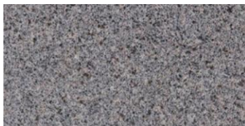
Granito cinza andorinha

Nas superfícies das mesas existentes, substituição de revestimento por GRANITO CINZA ANDORINHA, com acabamento polido em suas testeiiras/bordas.