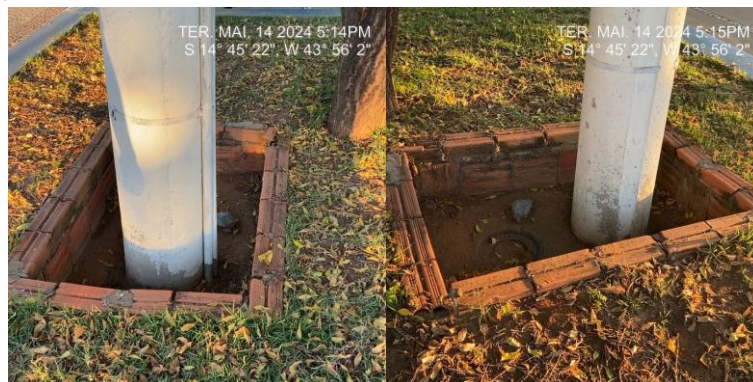
Caixa de Passagem existente: 1,25 m x 0,9 m

Fornecimento de tampa de concreto armado para caixa de passagem existente, conforme fotografia abaixo.