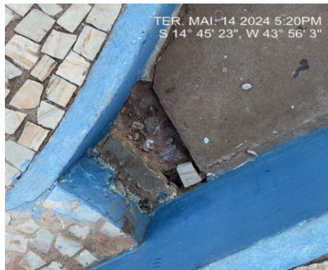
Pavimento a ser restaurado com uso de concreto