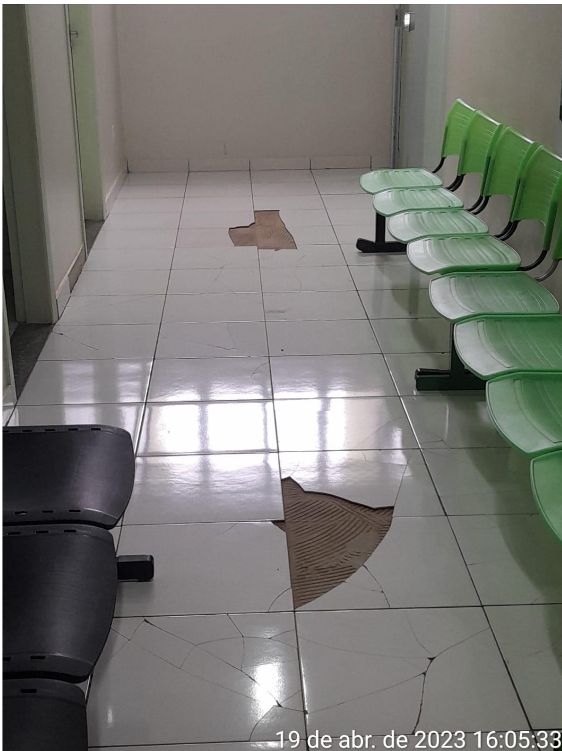
Foto 07 troca do Piso, sifão e torneira