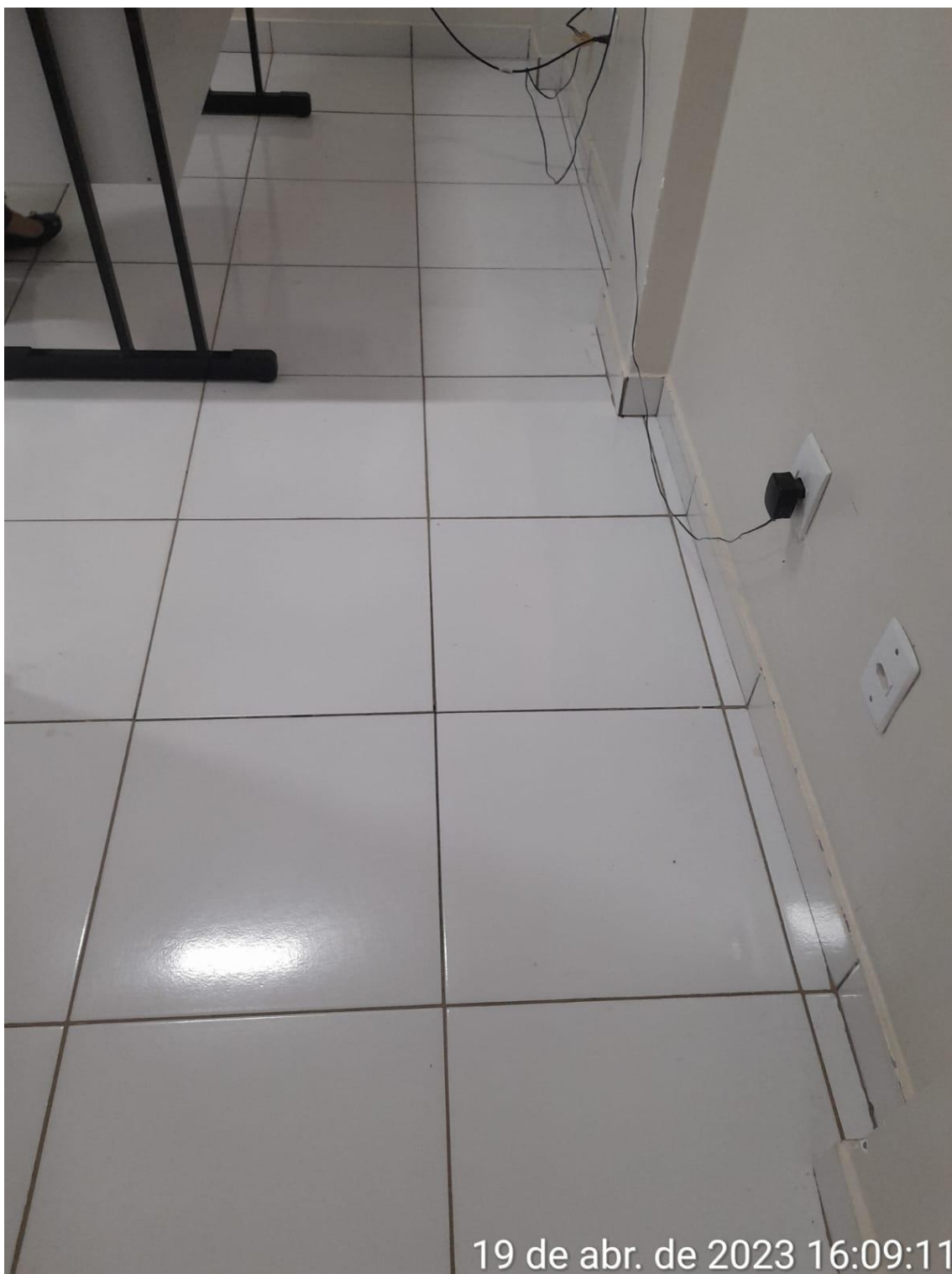
Foto 13 Adicionar mais tomada