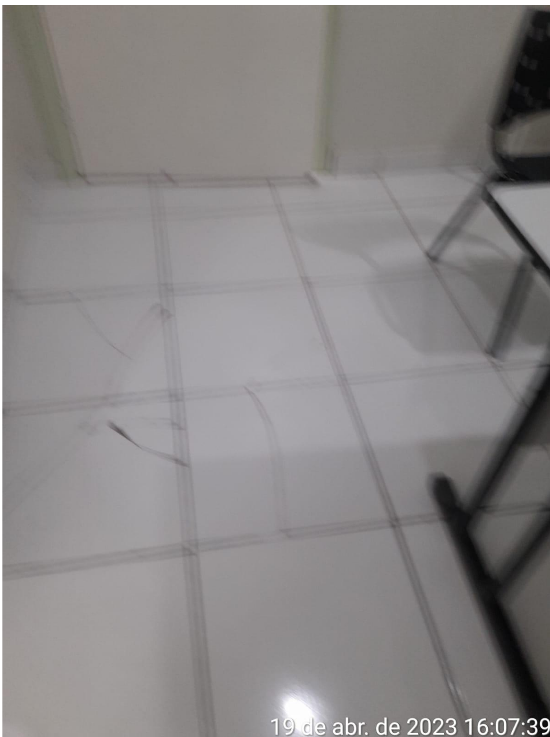
Foto 09 porta completa