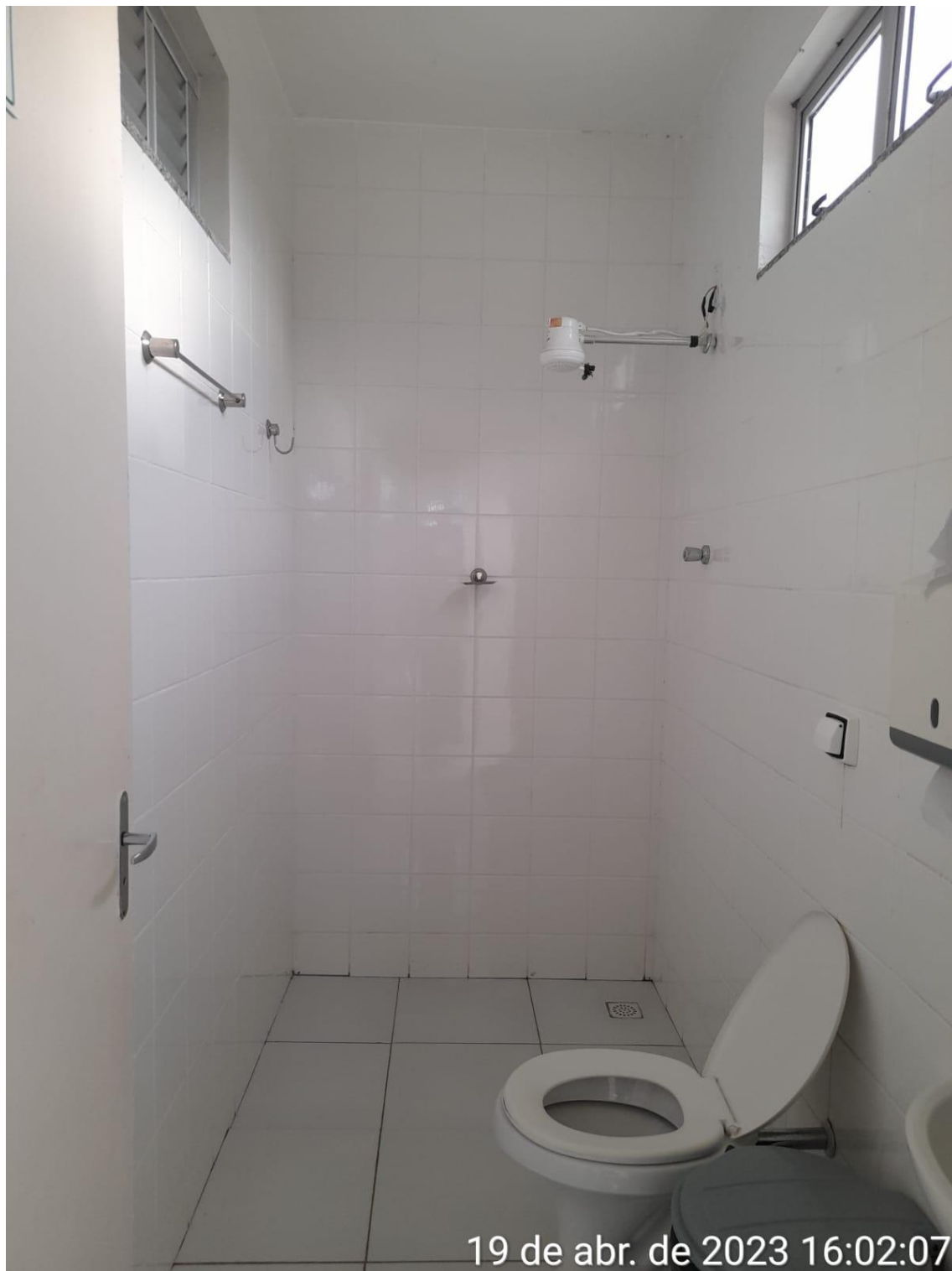
Foto 03 substituição da torneira, sifão e troca de fechadura