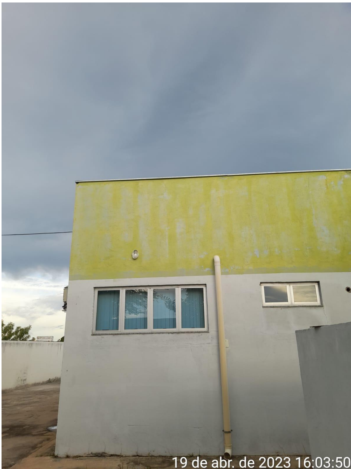
Foto 05 abrigo para Gás