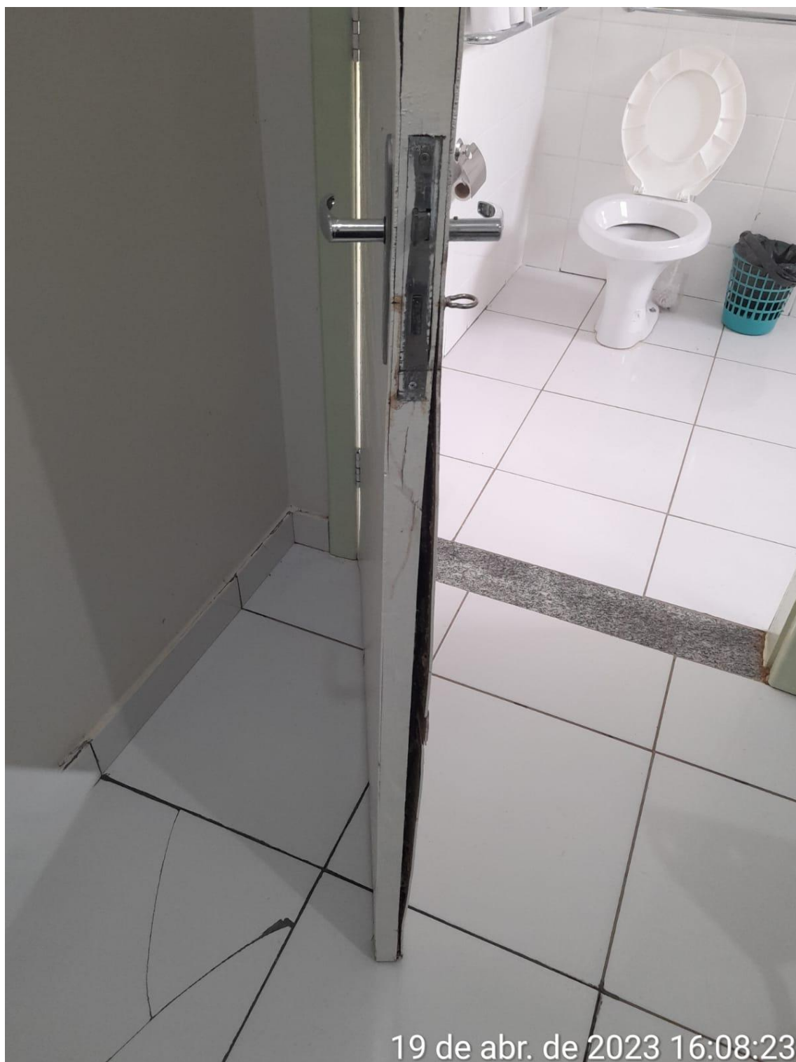
Foto 11 Barra de apoio para pessoa com mobilidade reduzida