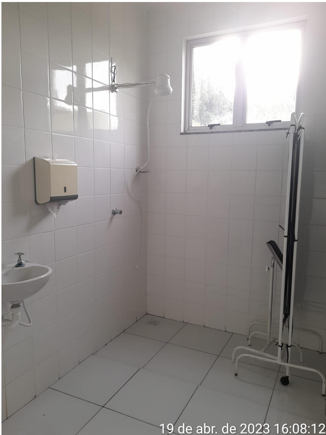
Foto 10 troca do piso cerâmica.