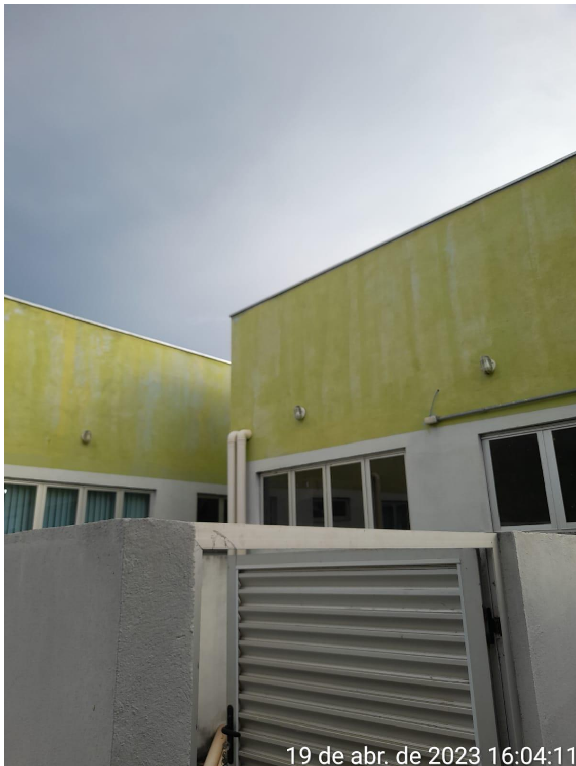
Foto 05 Pintura externa