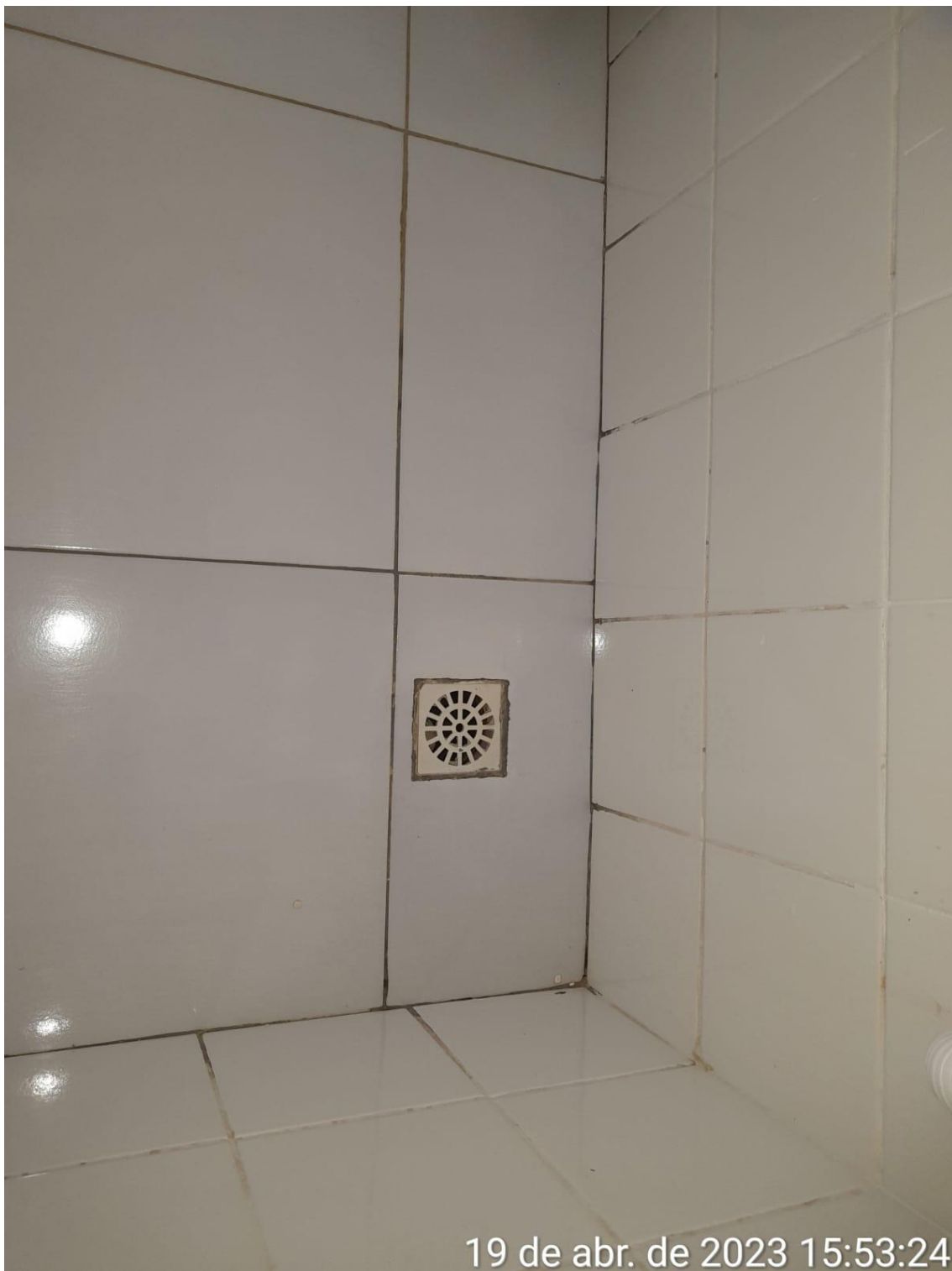
Foto 02 Substituição do ralo

Departamento de Engenharia Praça CelBembém, nº 1.477, Centro, Manga/MG – CEP: 39.460-000 Telefone: (38) 3615-2112 Email: obras.manga@gmail.com