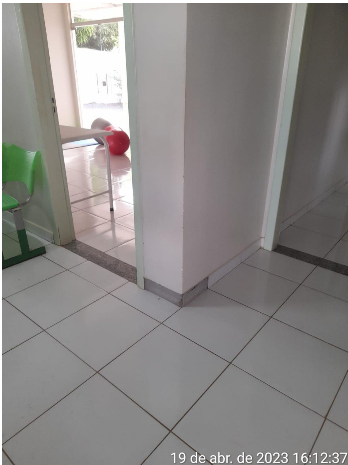
Foto 14 troca roda pé