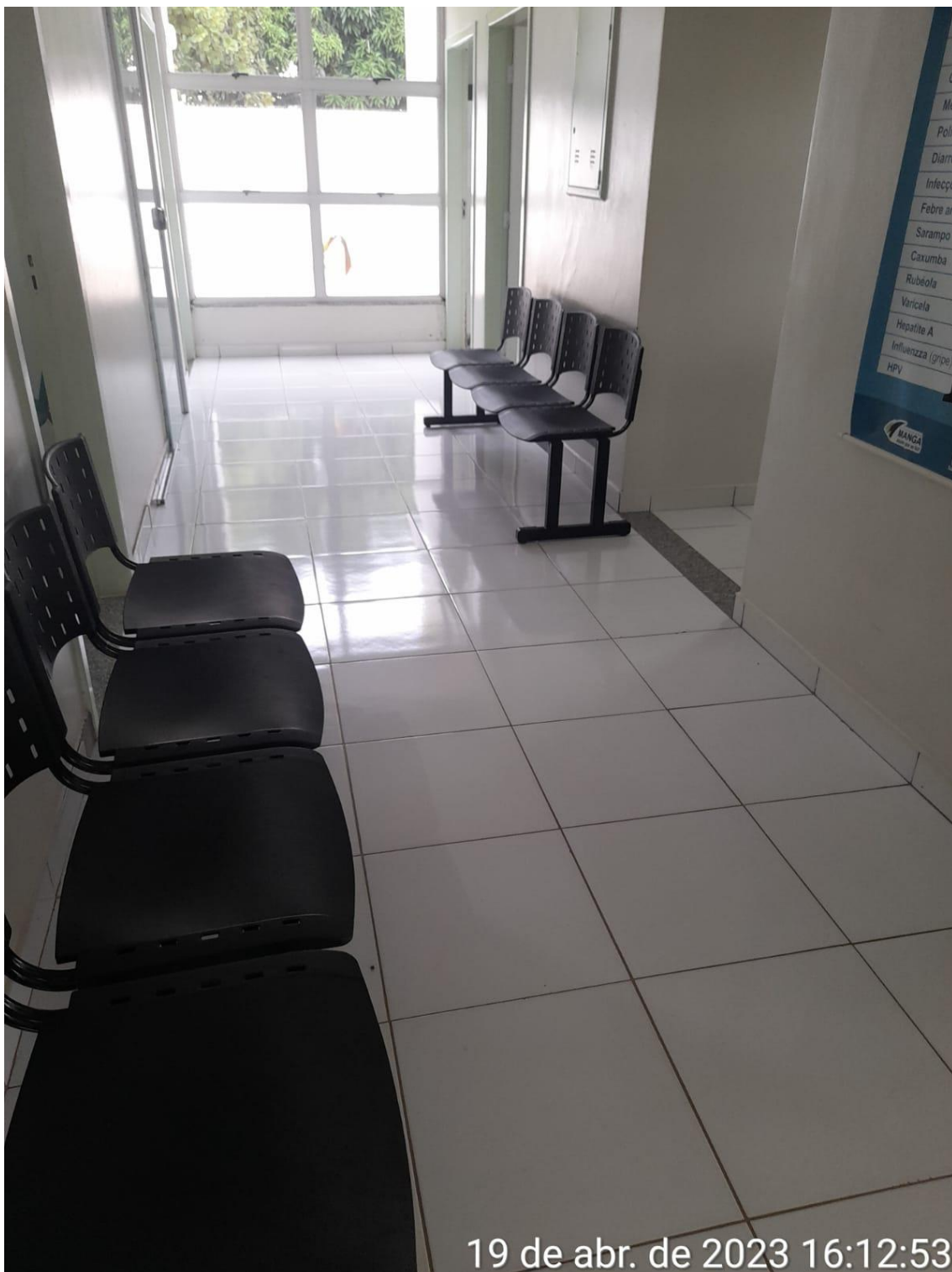
Foto 15 troca de Piso