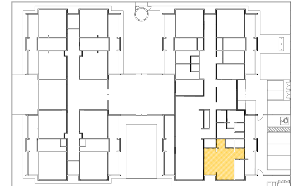
CROQUI DE REFERÊNCIA